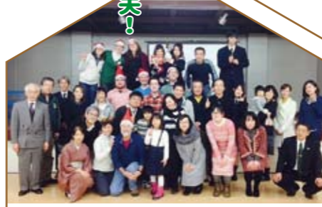
英語講座・ALT交流会 (クリスマス会)