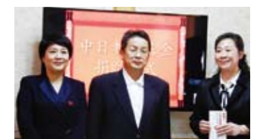
信陽市瀾河区(中国)