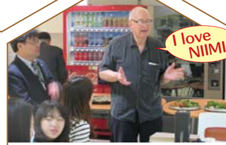
交流会 (デイベ会長を囲む会)