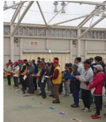
丁寧なレクチャーの様子