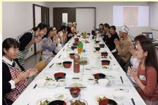
中国語講座・中国料理交流会

2020年はできませんでしたが、例年は中国語講座の最終日に中国料理交流を和気あいあいと楽しんでいます。