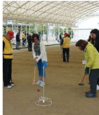
和気あいあいとプレイ!