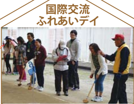
国際交流 ふれあいデイ