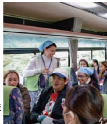
バスの中で自己紹介