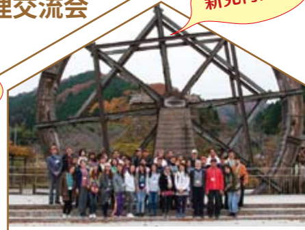
国際交流バスツアー