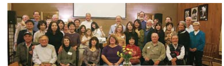
ニューパルツ(アメリカ)