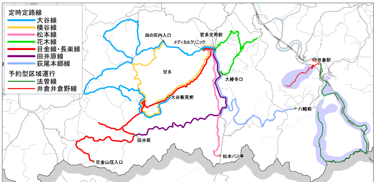
▲ふれあい送迎バス路線網