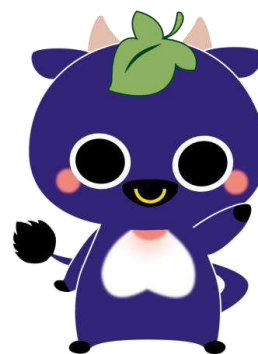
新見市マスコットキャラクター 「にいみん」

ピオーネから生まれた千屋牛の子どもです。 頭の葉っぱはピオーネの葉っぱ。 体はピオーネのようにおいしそうな紫色。 背中にはアテツマンサクが咲き乱れ、お腹には 桃の形をしたふわふわな毛があります。