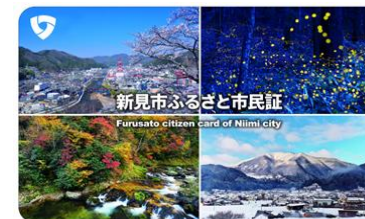
新見市ふるさと市民証