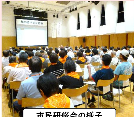
市民研修会の様子