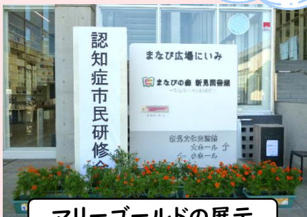
マリーゴールドの展示