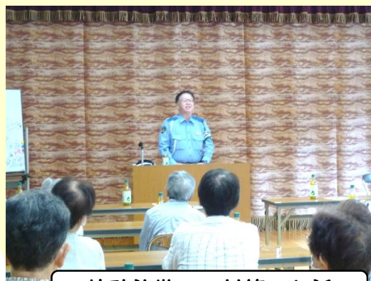
特殊詐欺への対策のお話

今後の開催は1月20日で寒い時期の開催となりますので、足元にお気を付けてお越しください。