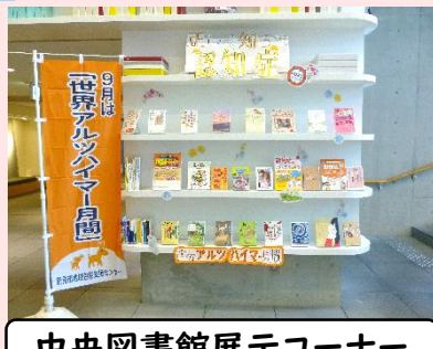
中央図書館展示コーナー