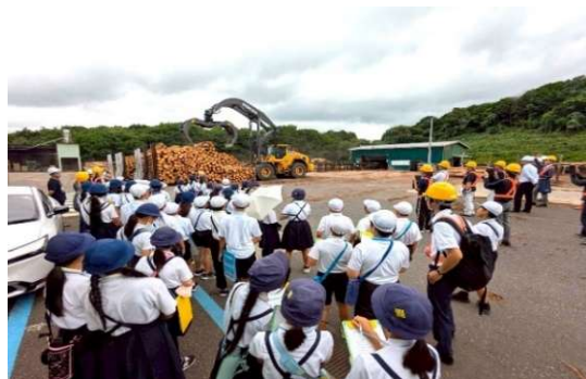
新校舎に使用される地元産の製材を見学する児童

大佐地区の刑部小学校と大佐中学校を一体とした施設一体型小中一貫校を整備します。（令和8年度は、校舎新築等工事、情報通信工事、工事監理業務委託を実施）