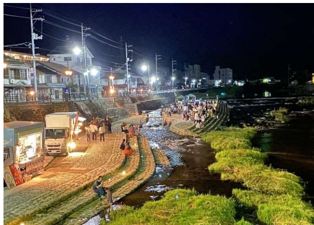
新見駅周辺みらいプロジェクトのイベントの様子

老朽化した社会体育施設の改修・更新を行います。（ピオーネ球場照明LED化、大佐B&G海洋センター改修設計委託、防災公園陸上競技場写真判定装置更新、ピオーネ球場スコアボードシステム更新）