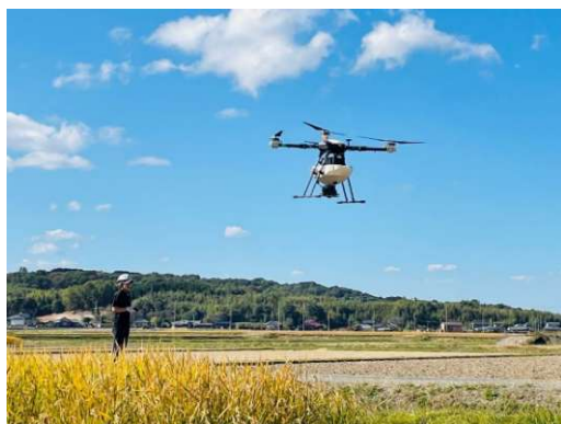
農業用ドローン（農林水産省HPより）

市内の中小企業が技術又は製品の販路開拓、店舗改修、外国語表記のホームページ等の作成、省力化を図る設備の導入などに対して支援を行います。