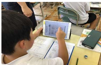
授業で使用しているタブレット端末