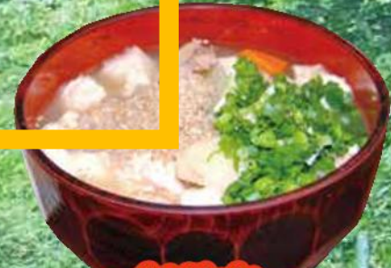
新見市 ケンチン蕎麦