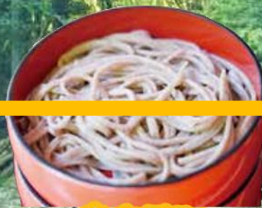
奥出雲町 割子そば