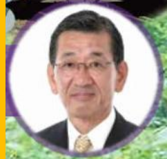
庄原市長 木山 耕三