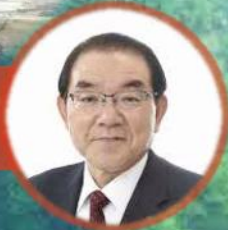
新見市長 戎 斉