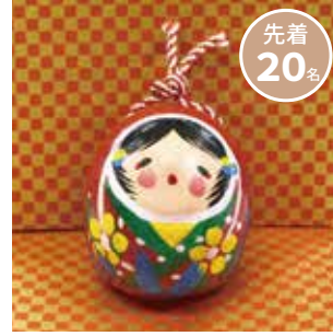
百々人形絵付け体験 百々人形保存会 (1個 500円)