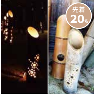
竹灯籠づくり やしろ振興協議会 (1個 500円)

* 体験は有料です。当日10時より各ブースにて受付を行います。 * 内容が変わる場合がございますので、ご了承ください。