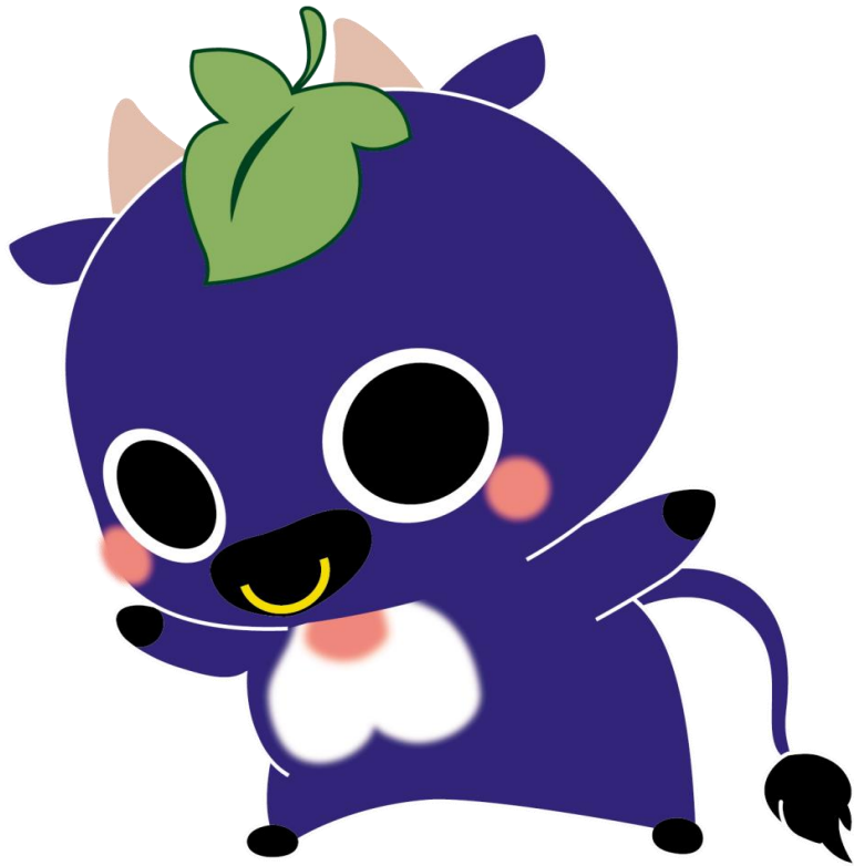
新見市マスコットキャラクター「にーみん」

に こにこと ほほえみ集う 人のまち い にしえの 心とロマン 伝えよう み らいへと 光れ振興 日本一