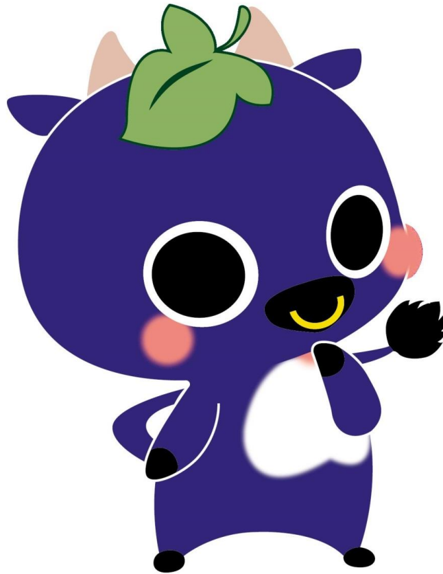
新見市マスコットキャラクター「にーみん」

に こにこと ほほえみ集う 人のまち い にしえの 心とロマン 伝えよう み らいへと 光れ振興 日本一