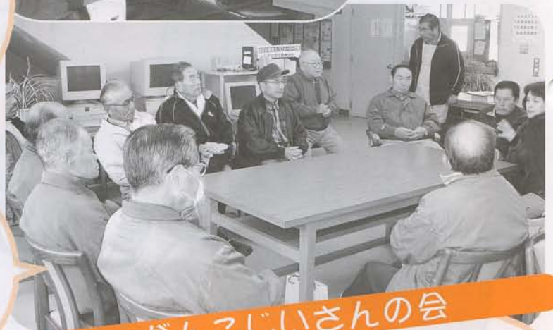
がんこじいさんの会

★生まれ変わるとしたらもう一回は男で生まれたい。今までの人生でもっとしたかったことがあるので...それから、次は女性の立場がよいうわからんからなってみたい。自分だと優しい女になれるかも...両方になってみたいなあ。