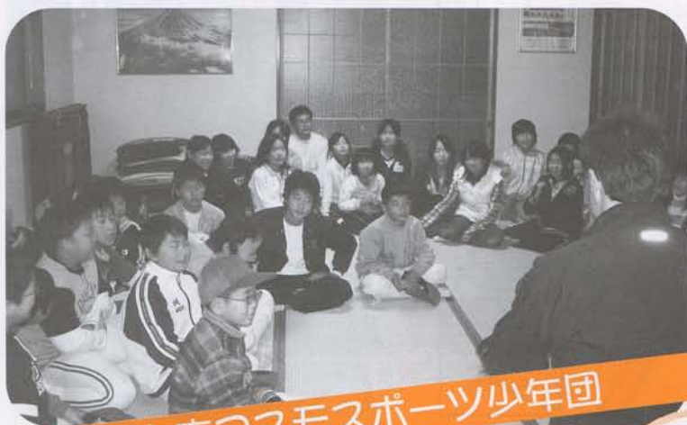
上市コスモスポーツ少年団

性による違いや見た目の違いなどが理由の主なものになっています。小学生にとってはちょっと考えにくい質問だったかもしれませんが、だだ、「ゴミ袋に名前を書く」ことが責任の表れと取れるように、大人にとってはなんでもないことが、いつの間にか子どもたちに男の方が責任が重いという考えを植えつけているのかもしれない。戦争には男が行く（戦争があるかもしれない）という答えには驚きました。