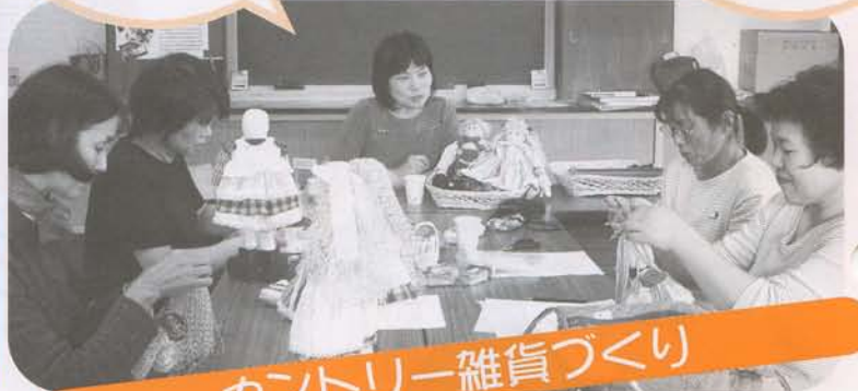
カントリー雑貨づくり

子育てがひと息ついて手が離れた年代7人が集まり、手芸を通じて月2回地域の仲間との交流を楽しんでおられます。女性同士の集まりでもあり女性の立場からの意見が多く聞かれました。