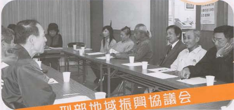
刑部地域振興協議会

★忙しそうだと家事を手伝おうかなと少しは思うけど、口に出して言えない。妻もこのままが一番良いと思っていると思う。