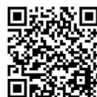
HPVワクチンについて