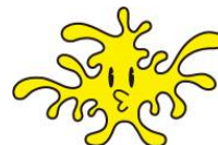
▲ アテツマンサクの「マンサクくん」