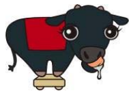
▲ 千屋牛の「チーくん」