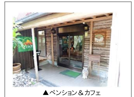
▲ペンション&カフェ

「地域の人たちに温かく迎えてもらい、たくさんの人に支援をしてもらっていることが、何よりも嬉しいです。将来、私たちが作った野菜をペンションで提供できるよう、がんばります。」と、新しい暮らしを満喫されています。