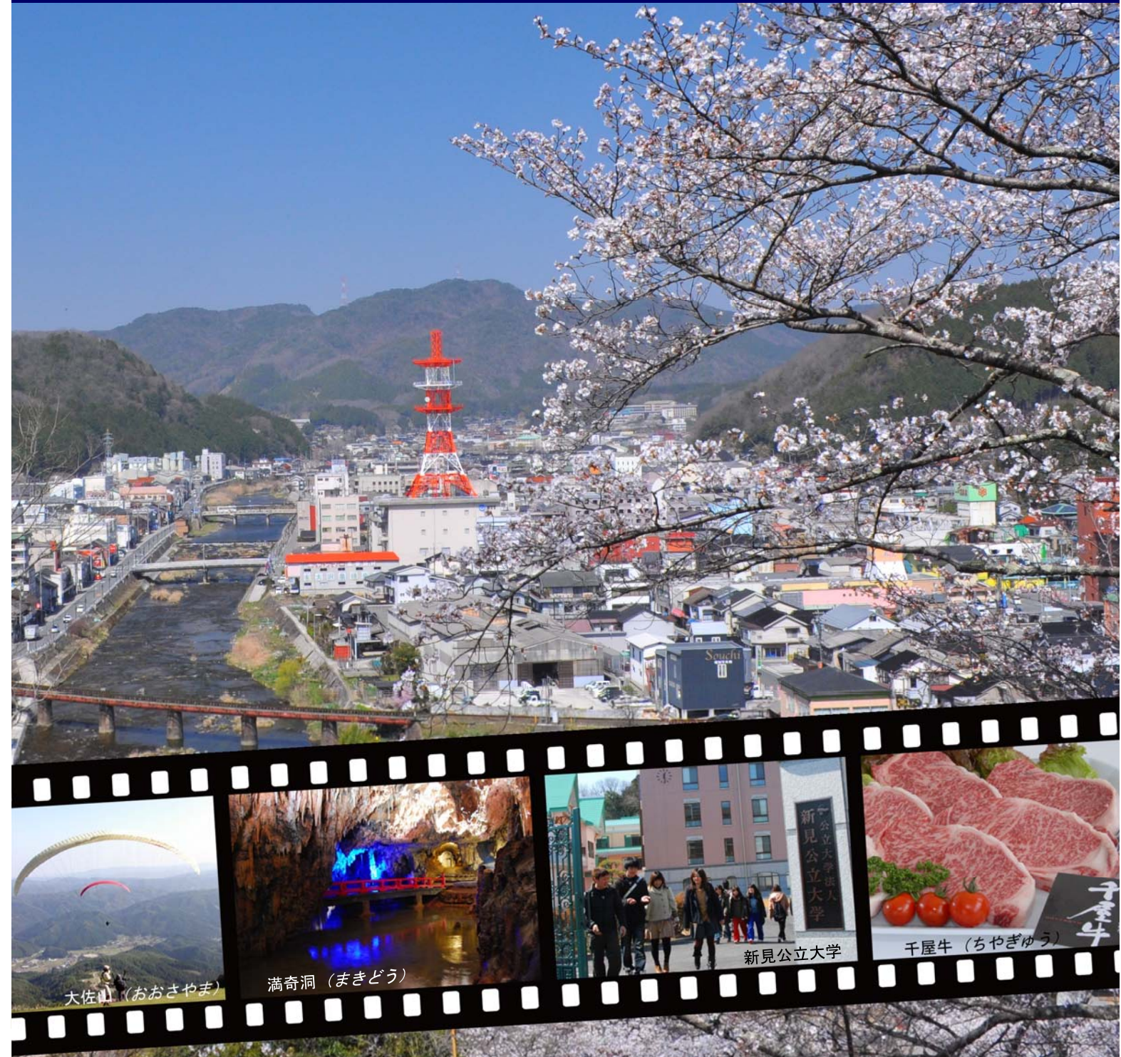
大佐山 (おおさやま)

新見市では、岡山県の『晴れの国おかやま 県民募集～8092人移住プロジェクト～』に呼応し “にいみ” にちなんで213人の移住者の確保に取り組みます！