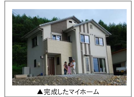
▲完成したマイホーム

念願のマイホームも完成し、ひとつひとつ着実に夢を実現させています。「新しいことにチャレンジして、魅力をもっとアピールして、若い人がもっと飛び込んでくるような地域をつくりたい。」と熱い想いを語ってくれました。